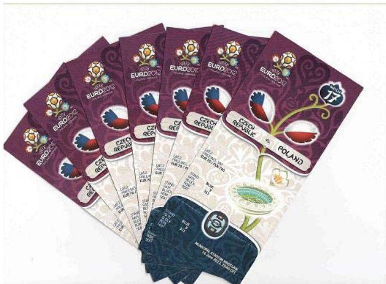
Polska-Czechy 16.06.2012 we Wrocławiu

Emissionshändler.com® rozlosuje 3 x 2 karty wstępu na mecz piłki nożnej Polska-Czechy, który odbędzie się w dniu następnym, tj. 16.06.2012 we Wrocławiu . Konkurs obejmuje tylko osoby obecne