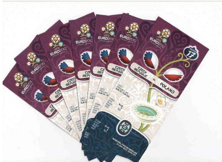
Polen-Tschechien 15.06.2012 in Wroclaw

Emissionshändler.com® verlost 3 x 2 Eintrittskarten für das Fußballspiel Polen-Tschechien am nächsten Tag, den 15.06.2012 in Wroclaw . Teilnahmeberechtigt sind nur die anwesenden Personen.