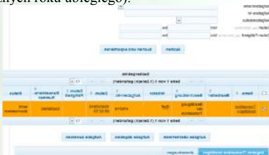
Menu Potwierdzenie zadania

Potwierdzający pełnomocnik wchodzi do systemu rejestru przez menu Lista zadań i odznacza po lewej stronie zadanie do potwierdzenia w koncie rejestru (tutaj umorzenie EUA w wysokości wielkości emisji rocznych roku ubiegłego).