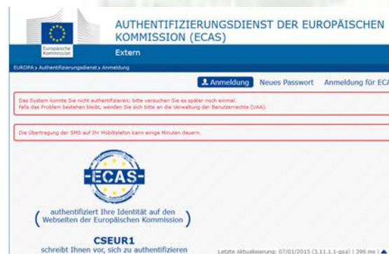
Komunikat o "nieznanym użytkowniku"

Jeśli zbyt wielu użytkowników korzysta równocześnie z systemu, to może często dochodzić do komunikatów błędów, przerw i zawieszonych.