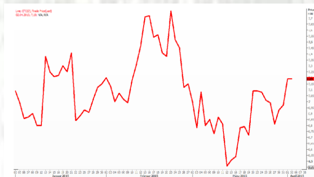
EUADCE15 01.01.2015 do 02.04.2015