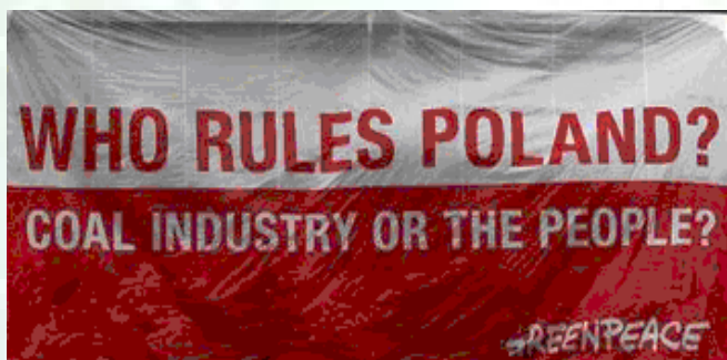
Plakat na ścianie polskiego Ministerstwa Gospodarki

Na plakacie tym widniało prowokacyjne pytanie, kto właściwie rządzi krajem, przemysł węglowy, czy polskie społeczeństwo?