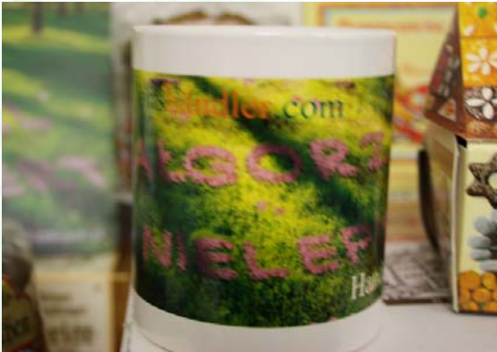
Tasse mit Namen des Beschenkten

Natürlich ist es auch möglich, zu arbeiten und mit seiner Maus am PC das Mousepad zu benutzen und dabei einen schönen Kaffee aus der eigenen Tasse zu trinken.