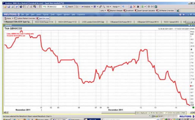
Tages-Tief EUA Spot am 14.12.11 6,31 Euro/t

Nun war auch den noch zögerlichen Anlagenbetreibern klar, dass es nur noch darum ging, möglichst rasch sämtliche Überbestände zu verkaufen. Die dann folgende Abwärtsralley zog den EUA-Spot bis auf 6,31 Euro/t hinunter.