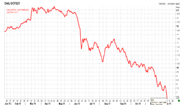
EUADEC11 01.2011 – 12.2011