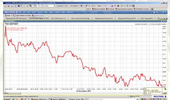
Tages-Tief EUADEC11 am 14.12.11 6,32 Euro/t

diesem Mittwoch auf bis zu 6,32 Euro/t ab und damit auf den tiefsten Stand der Handelsperiode.