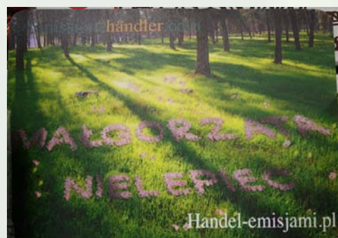
Mousepad für Kunden von Emissionshändler.com®

Wir haben uns überlegt, dass unsere Kunden im bevorstehenden kalten Winter mit Schnee und Eis vielleicht gerne auch einmal auf einer Waldwiese mit den Namens-Blümchen des Besenkten ausruhen möchten.