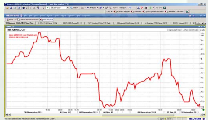
Schlusspreis EUA Spot am 13.12.11 7,05 Euro/t

Der verbliebene Rest der Optimisten hatte sich noch am Montag, den 12.12.2011 um 10.00 früh in Sicherheit gewogen, als sich der Tiefpreis der Vorwoche von zunächst 6,97 Euro/t wieder auf 8,00 Euro erholt hatte. Dann jedoch begann eine Talfahrt, die erst am nächsten Tag, den 13.12.2011 um 18h bei 7,05 Euro/t endete. Damit wurde das Allzeit-Tief von 6,97 Euro/t der Vorwoche vom 06.12.2011 fast erreicht.