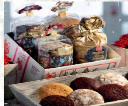
Verschiedene leckere Lebkuchenspezialitäten

Handel-emisjami.pl ist der führender Anbieter von spezialisierten und kostenlosen Informationen für den CO2-Markt in Polen. Auf der Website von www.handel-emisjami.pl finden Sie rechts die News Info Box , in der Sie täglich aktualisierte und kostenlose Informationen zum Thema CO2 finden. Wir laden Sie herzlich ein unsere Website zu besuchen!