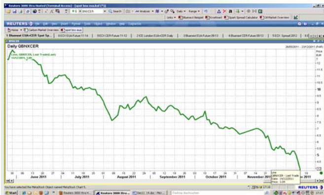
Allzeit-Tief CER Spot am 14.12.11 3,89 Euro/t

Parallel zu den stark fallenden EUA-Spot-Preisen ging der CER-Spot in fast gleichem Ausmaß zurück und erreichte das Allzeit-Tief von 3,89 Euro/t.