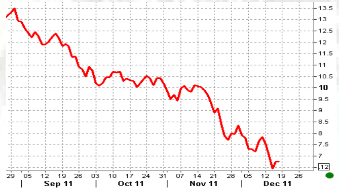
Preissturz seit Veröffentlichung der Bankanalysen

Analysten der HSBC nicht mehr ignorieren und veröffentlichten erstmals zum September eine entsprechende Analyse, in der dieses Null-Preis-Szenario detaillierter untersucht und veröffentlicht wurde.