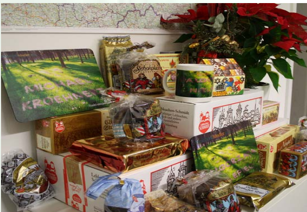
Lebkuchenspezialitäten und persönliche Geschenke

Wir wünschen allen unseren Kunden und Geschäftspartnern, dass unsere Weihnachtsgrüße rechtzeitig und wohlbehalten ankommen und freuen uns mit Ihnen gemeinsam auf noch viele Jahre Beratung, Handel und Vertrauen im Emissionshandel in Polen.