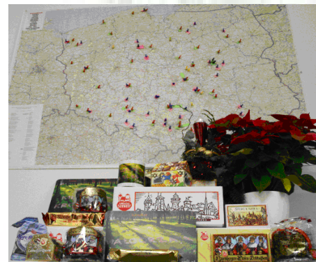
Lebkuchenpaket vor Landkarte Polen

In den Paketen waren aber nicht nur die leckeren Lebkuchen, sondern auch wie immer eine sehr persönliche Überraschung enthalten.