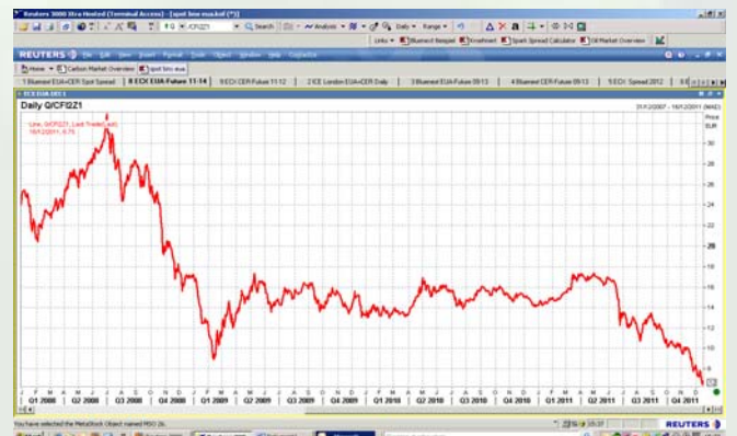
EUADEC11 mit 81% Verlust in 4 Jahren

Genauer auf die gesamte Handelsperiode betrachtet liegt der Preisrückgang sogar bei 81%, wenn man den 01.07.2008 betrachtet, bei dem ein Höchstwert von 32,90 Euro/t erreicht wurde.